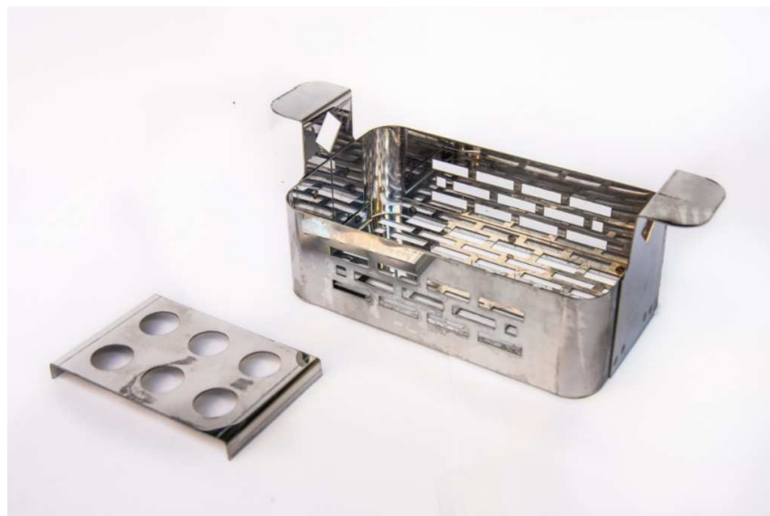
Canasto y Portainyectores de FT-1350